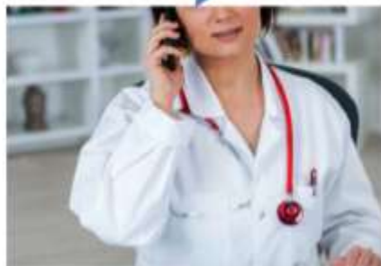
Clinicien de première ligne