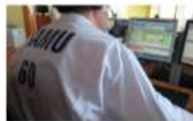
SAMU-Centre 15 territorialement compétent