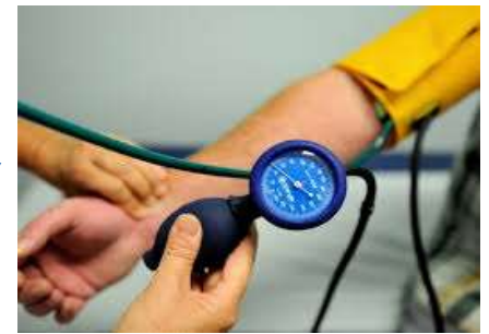
Professionnel de santé